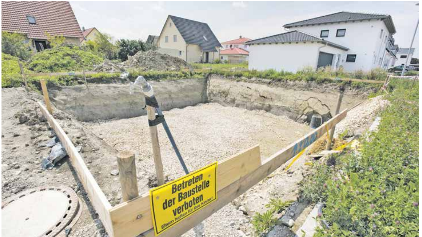
Bevor der Bau eines Eigenheims startet, muss zunächst der passende Baugrund gefunden sein.