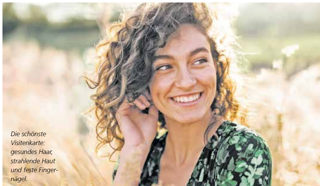
Die schönste Visitenkarte: gesundes Haar, strahlende Haut und feste Fingernägel.

Der zentrale Bestandteil von Kieselsäure-Gel ist Silizium, das nach Sauerstoff zweithäufigste Element der Erde. Im menschl-