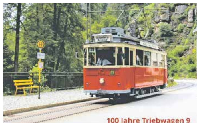
100 Jahre Triebwagen 9

Redaktion: Solveig Großer, Regionalverkehr Sächsische Schweiz-Osterzgebirge GmbH