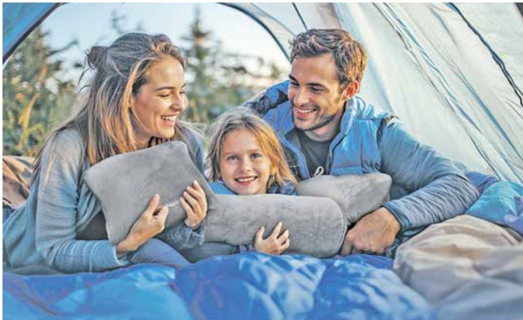
Kleine Reiseutensilien können auch unterwegs für Gemütlichkeit sorgen.

Eine dunkle Schlafmaske beispielsweise kann helfen, störende Lichtquellen auszublenden