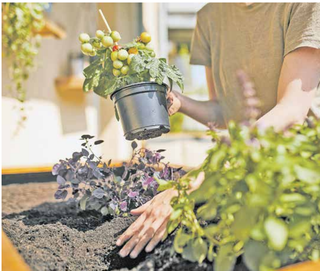
Vorsorgen für eine reiche Ernte: Nach einigen Jahren sollte die oberste Schicht im Hochbeet aufgefüllt werden. Starkzehrende Gemüse- und Obstsorten profitieren besonders von einem Nachschub an Nährstoffen durch frische Erde.

Wachstum von Gemüse und Kräutern. Zum Auffüllen bietet sich vor allem ein Zeitraum besonders gut an: „Im Frühjahr vor der Hauptbepflanzung lässt sich das Hochbeet gleich so vorbereiten, dass die neue Saison mit lockerer, nährstoffreicher Pflanzerde startet“, erklärt Dipl. Gartenbauingenieur und Compo-Experte Werner Peitzmann. Die Sommermonate eignen sich eher zum Auffüllen kleinerer Mengen, beispielsweise wenn sich Mulden bilden oder Wurzeln freiliegen sollten. Wichtig ist in jedem Fall die Auswahl eines geeigneten, nährstoffreichen Substrats. Als dritte, oberste Schicht im Hochbeet eignet sich beispielsweise die Compo Bio Hochbeeterde torffrei, da sie eine lockere Struktur aufweist und gut auf starkzehrende Gemüse- und