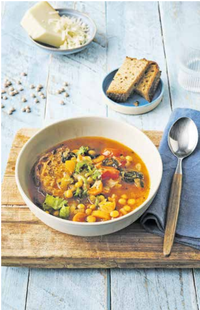
Hülsenfrüchte lassen sich vielfältig zubereiten. Hier zum Beispiel als Ribollita, eine traditionelle Gemüsesuppe aus der Toskana.