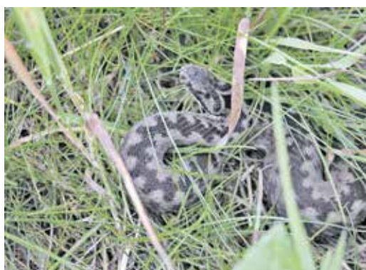
Seltener Anblick: Kreuzottern tragen ein typisches Zickzack-Muster auf dem Rücken.

Kreuzottern sind sowohl in Tschechien als auch in Sachsen gefährdet. Zu deren Schutz ist es nötig herauszufinden, wo genau sie leben. Daher wird auch dieses Jahr wieder die Mitmachaktion durch die Naturschutzstation Osterzgebirge und die Untere Naturschutzbehörde des Landkreises für die Frühjahrs- und Sommersaison 2026 initiiert.