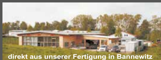
direkt aus unserer Fertigung in Bannewitz

Bungalow - Wohnhäuser www.bungalow-wohnhaus.de