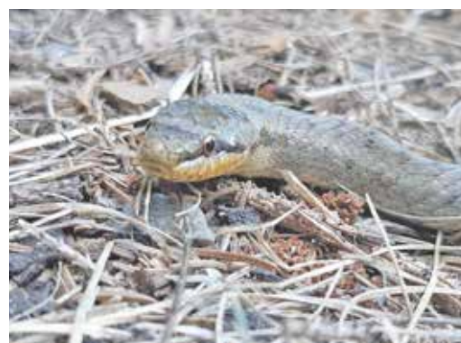
Schlingnattern haben eine runde Pupille - keine schlitzartige wie die Kreuzotter.

Weitere Fragen richten Sie sehr gern an: pflegekinderdienst@landratsamt-pirna.de