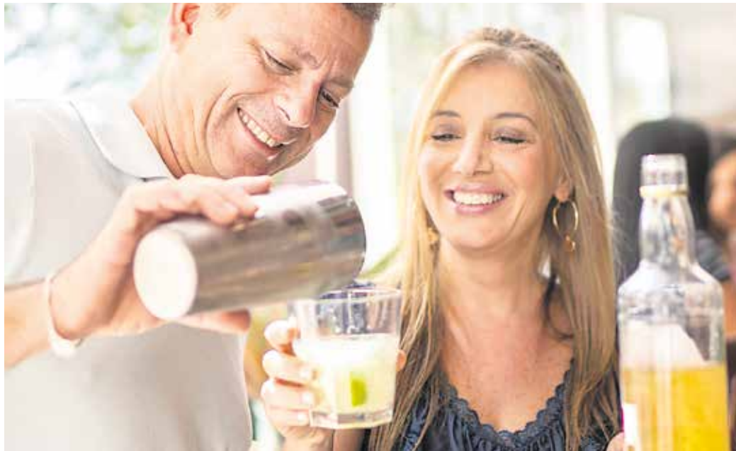
Hobby-Barmixer brauchen nur ein paar Dinge als Grundausstattung, um mit dem Shaken starten zu können.

Der Einstieg in den Cocktailgenuss ist mit überschaubaren Kosten und nur einigen grundlegenden Accessoires für die private Bar verbunden. Grundvoraussetzung zum Shaken mit Schwung ist ein sogenannter Boston-Shaker - auch ein Barsieb und ein kleiner Messbecher, bekannt als „Jigger“, für das Abmessen der flüssigen Zutaten dürfen nicht fehlen. Wer zum Beispiel gerne einen Caipirinha genießt oder für andere Rezepturen Limetten und weitere Früchte zerdrücken will, braucht noch einen Stößel dazu. Ein Barlöffel zum Umrühren sowie vor allem elegante Gläser runden die Ausstattung ab. Genau hinschauen sollten Hobbybarmixer bei den Zuta-