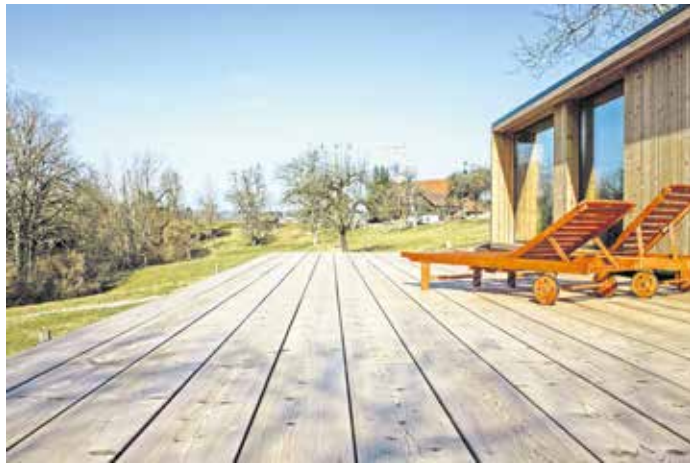
Holz zählt zu den ältesten Baumaterialien, die der Mensch nutzt - und ist unter Aspekten des Klimaschutzes gleichzeitig Rohstoff der Zukunft.

In ökologischer Hinsicht weist das Naturmaterial viele Vorteile auf. Einem nachhaltig bewirtschafteten Wald wird nur so viel Holz entnommen, wie wieder nachwachsen kann, ohne die Ressourcen zu erschöpfen. Zudem nehmen Bäume während ihres Wachstums klima-