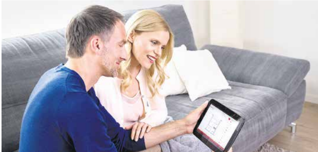
Smarte Sicherheitstechnik vom Fachmann schützt und ist komfortabel zu bedienen.

An die Gewährung von Fördergeldern hat der Gesetzgeber allerdings Bedingungen geknüpft. „Kein Geld gibt es für Baumarkt-Lösungen Marke